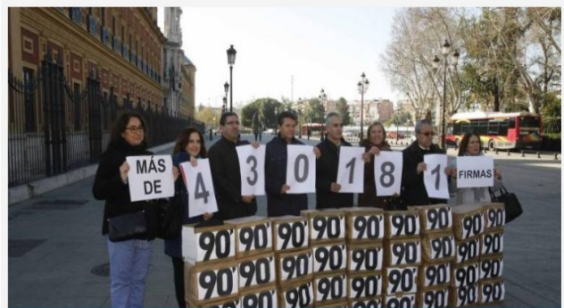
Los sindicatos recogieron más de 400.000 firmas en defensa de la asignatura de Religión por toda Andalucía

Solicitan por escrito que «respeten» la carga horaria de 90 minutos semanales y los últimos dictámenes del TSJA