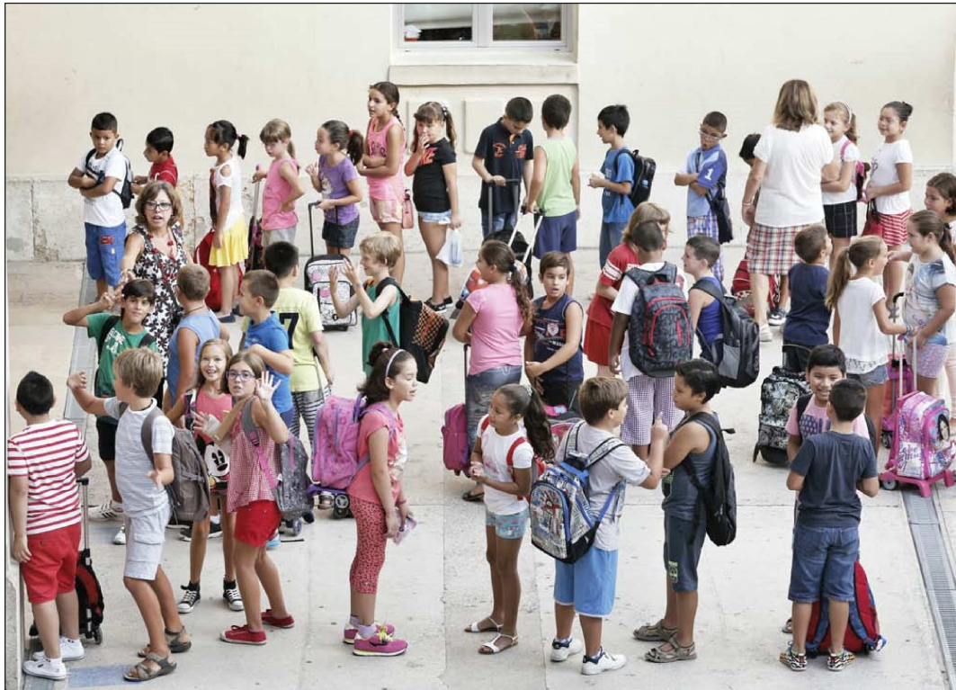
Alumnos de un colegio público de Valencia esperan para entrar en el aula el primer día de colegio

20 se les ha impuesto media jornada, «a pesar de que muchos, con 20 años de experiencia, están próximos a jubilarse y van a ver reducida su base impositiva justo antes de que se tenga que calcular su pensión. Y luego el Gobierno cacarea sobre la defensa de los trabajadores», dice González Bolaños.