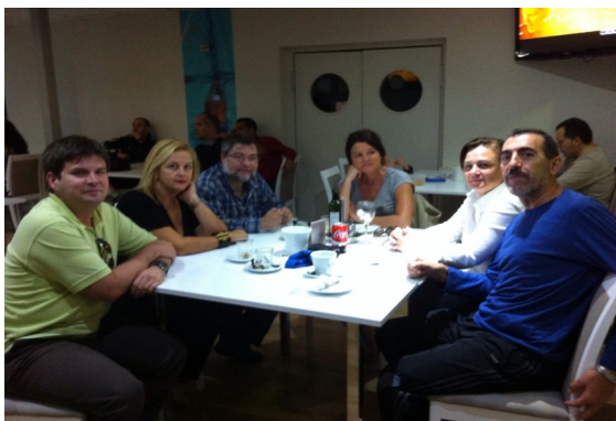
Reunión de la Junta Directiva de Apprece Almería tanto de Primaria como de Secundaria

✓ AMPLIACIÓN HORARIA: En septiembre de 2017 se certificaron 882 horas de Religión Católica en los IES de la provincia de Almería. Esto supone que haya 41 horas más con respecto al curso pasado . De 79 centros, 12 aumentan su horario, el resto mantuvieron la previsión de Julio.