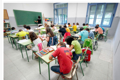
Aula de un colegio en España.

235 profesores imparten la asignatura en 13 comunidades a más de 15.000 alumnos. La coordinadora nacional Ana Calvo explica la situación en España.